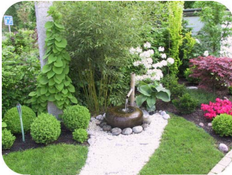
Bachi mit Trockenfluss für die Aktivierung auf der männlichen Garten-Seite